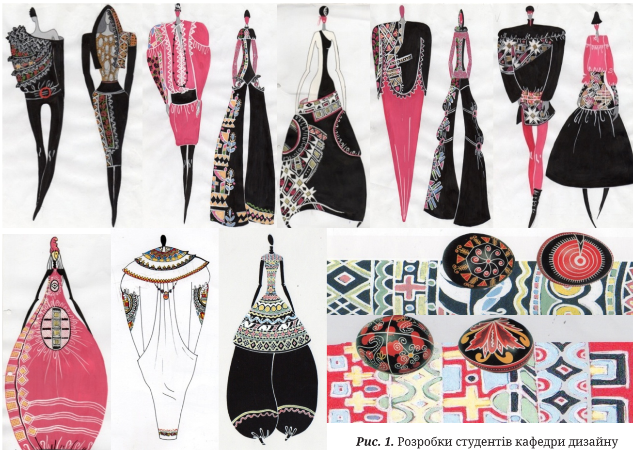
Рис. 1. Розробки студентів кафедри дизайну ХНПУ імені Г.С.Сковороди

Використання студентами елементів традиційного декоративно-ужиткового мистецтва надає сучасним колекціям одягу естетичної виразності, оригінальності, рукотворності і сприяє розвитку національної мистецької культури. Під час розробки сучасного одягу, на основі національних традицій здобувачі користуються основними елементами, а саме: принципами формоутворення, тектонічною структурою форми, пропорцією, ритмом, колоритом, орнаментациєю, конструктивною побудовою, матеріалом, традиційною технологією виготовлення (див. рис. 1; рис. 2).