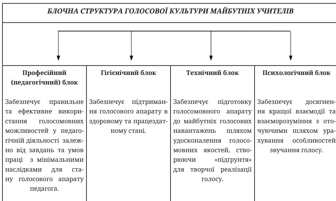
Рис. 1. Блочна структура голосової культури майбутніх учителів

На рис. 1 представлено блочну структуру голосової культури майбутніх учителів.