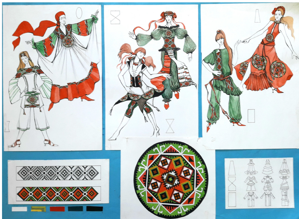
Рис. 5 Розробки студентів кафедри дизайну ХНПУ імені Г.С.Сковороди