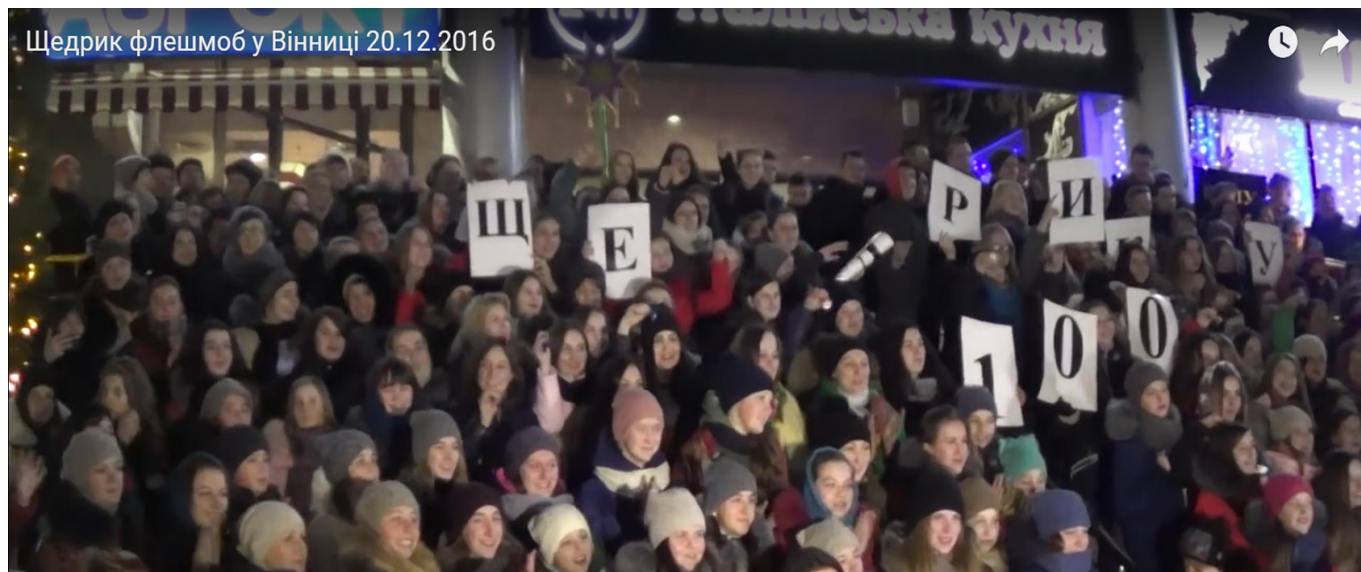
Рис.4 – Рис.4 Хоровий флешмоб, присвячений 100-річчю виконання української народної пісні «Щедрик»

Популяризації хорового співу та виявленню нових обдарувань у сфері хорового мистецтва сприяють хорові шоу. Хорове шоу – це вистава або телевізійна програма, в якій виступають хори або вокальні групи. Це може бути масштабне вокально-хорове дійство з костюмами, хореографією та спецефектами, або простіше виконання пісень у вокальному ансамблі. Хорове шоу може включати у себе різноманітні музичні жанри, від класики до популярної музики, а також може бути організоване у формі конкурсу, де співацькі колективи змагаються за перемогу.