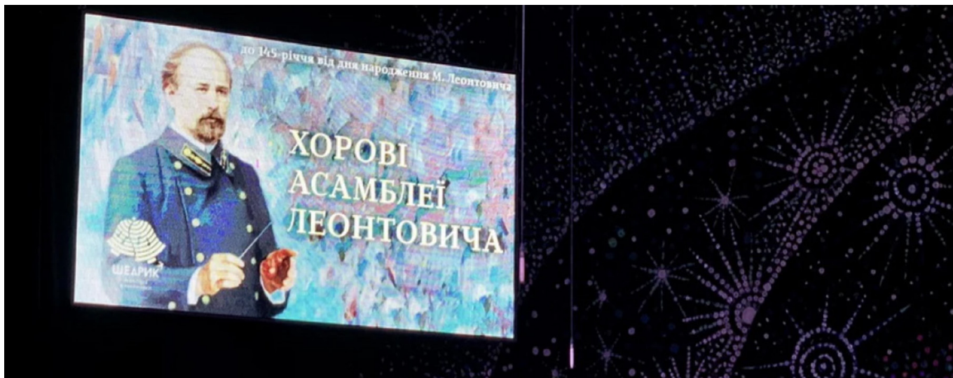
Рис.1 – Мистецький проект «Хорові асамблеї Миколи Леонтовича»

тецтва метою яких є обговорення певної проблеми та прийняття рішень або здійснення певних дій. Приклад «Хорових асамблей Миколи Леонтовича» (м. Вінниця) доводить, що для них характерно поєднання як виконавських, так і навчально-методичних event-форм (майстер класів, методичних семінарів, концертних виступів тощо). Саме ця властивість робить хорові асамблеї унікальними мистецькими заходами (див. рис.1).