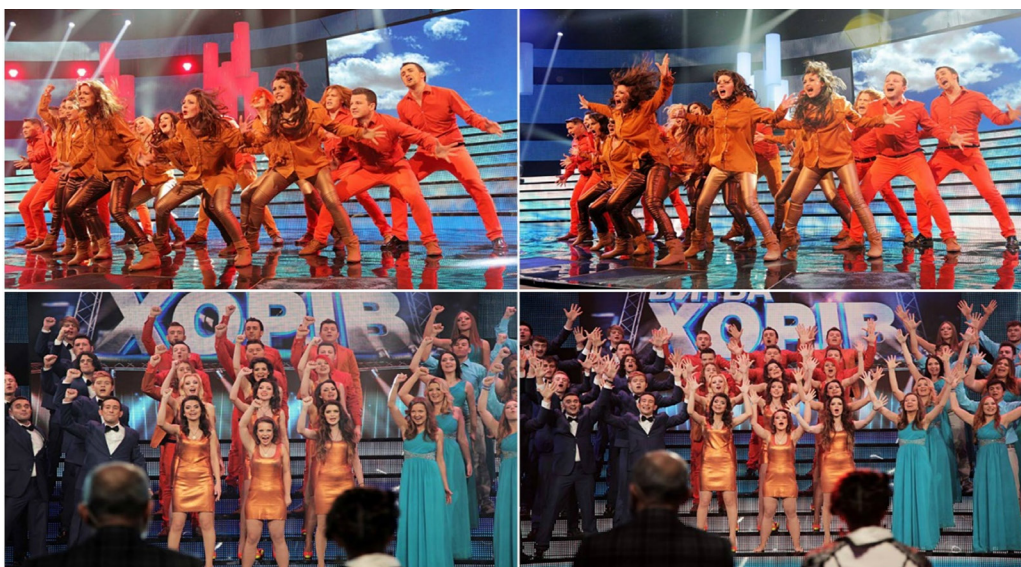
Рис.5 – Українське шоу «Битва хорів» 12 січня 2014р

Яскравим прикладом хорових івентів є «Битва хорів» – це телевізійне розважальне шоу, яке зазвичай включає в себе змагання між різними хоровими групами. Вперше формат хорового телешоу розробили у США під назвою «Clash of the Choirs» і провели серед аматорських естрадних хорових колективів компанією NBC. Згодом такий формат був запозичений телекомпаніями багатьох інших країн, в тому числі, з 2013 – українською телекомпанією «1+1». У програмі різні хори виступають зі своїми унікальними аранжуваннями пісень у різних стилях музики. Часто це шоу організовується у формі конкурсу, де хори змагаються за призи або титул кращого хору (див. рис. 5).